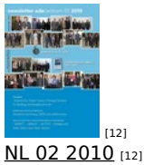
[12] NL 02 2010 [12]