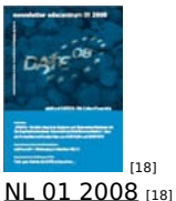
[18] NL 01 2008 [18]