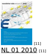
[11] NL 01 2010 [11]