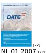
[22] NL 01 2007 [22]