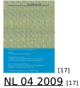
[17] NL 04 2009 [17]