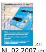
[23] NL 02 2007 [23]