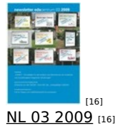
[16] NL 03 2009 [16]