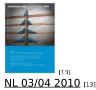
[13] NL 03/04 2010 [13]