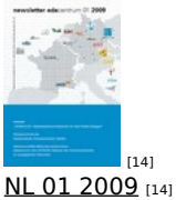
[14] NL 01 2009 [14]