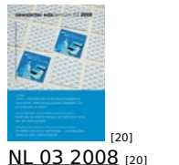
[20] NL 03 2008 [20]