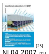
[25] NL 04 2007 [25]