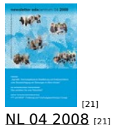
[21] NL 04 2008 [21]