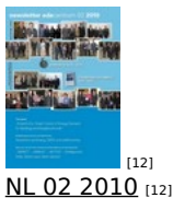
[12] NL 02 2010 [12]