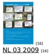
[16] NL 03 2009 [16]