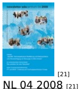
[21] NL 04 2008 [21]