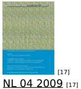
[17] NL 04 2009 [17]