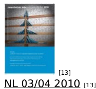
[13] NL 03/04 2010 [13]