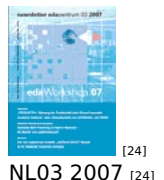
[24] NL 03 2007 [24]