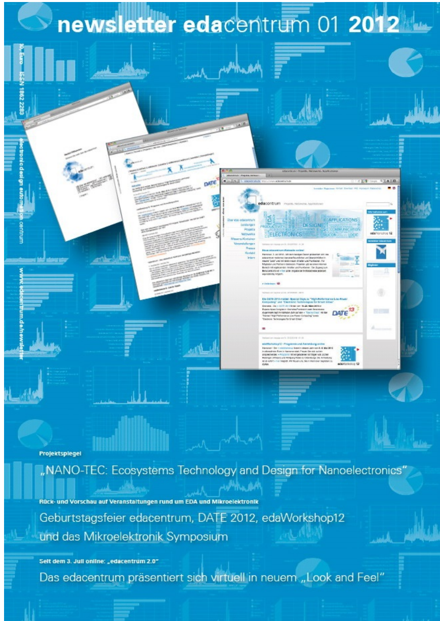
[10] NL 01 2012 [10]