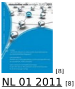
[8] NL 01 2011 [8]