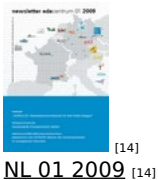
[14] NL 01 2009 [14]