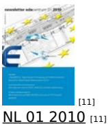
[11] NL 01 2010 [11]