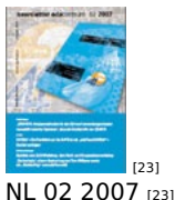
[23] NL 02 2007 [23]