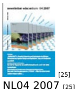
[25] NL 04 2007 [25]