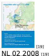
[19] NL 02 2008 [19]