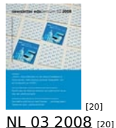
[20] NL 03 2008 [20]