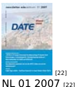
[22] NL 01 2007 [22]