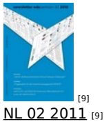
[9] NL 02 2011 [9]